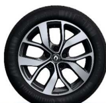
Aluminijski naplatci 17''