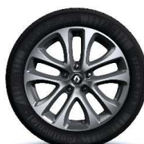
Aluminijski naplatci 17''