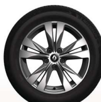
Aluminijski naplatci 17''