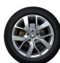
Aluminijski naplatci 16'' Celsium