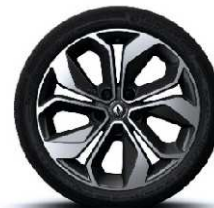
Aluminijski naplatci 18''