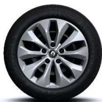
Čelični naplatci 16'' s ukrasnim pokrovima kotača Florida

* Samo u kombinaciji s paketom GT-Line S = Serija O = Opcija - = nije dostupno