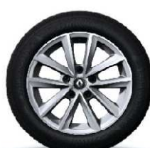
Aluminijski naplatci 16'' Silverline