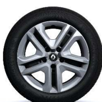
Čelični naplatci Flexwheel 16'' s ukrasnim pokrovima kotača Complea