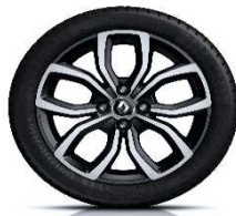
16" aluminijski naplatci Pulsizer - Crna