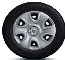
Ukrasni pokrovi kotača Extreme 15"