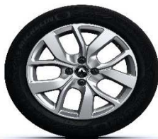
16" aluminijski naplatci Celsius