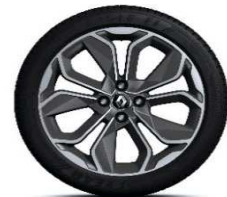
17" aluminijski naplatci Optemic - Krom&Siva