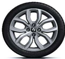
16" aluminijski naplatci Pulsizer - Krom