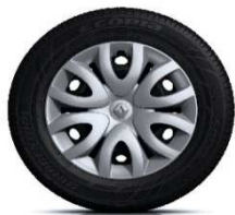
Ukrasni pokrovi kotača Paradise 15"