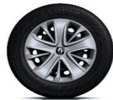
Ukrasni pokrovi kotača Lagoon 15"