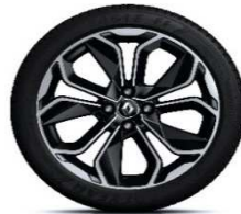
17" aluminijski naplatci Optemic - Krom&Crna